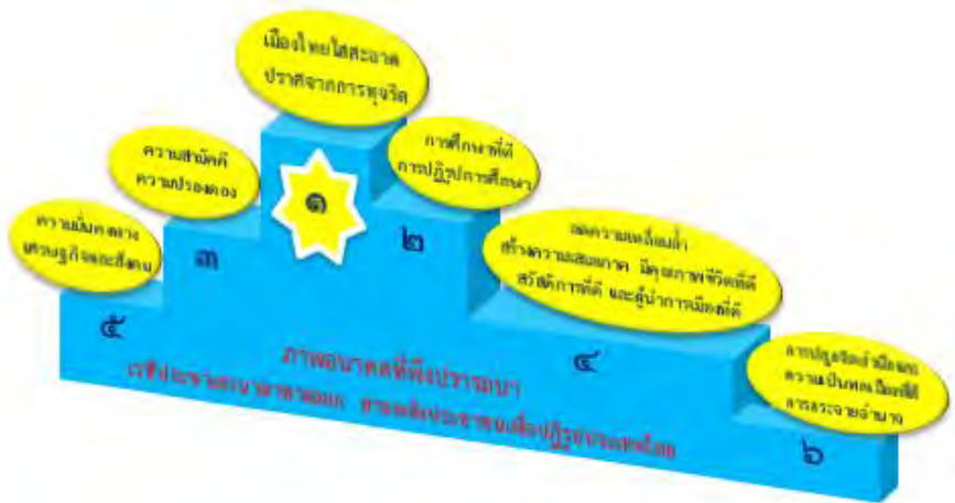
ภาพ ๑ สรุปผลการจัดอันดับข้อมูลภาพอนาคตที่พึงปรารถนาของประชาชน ที่เข้าร่วมเวทีประชาเสวนาให้ความสำคัญมากที่สุด

ข้อมูลข้างต้นแสดงให้เห็นว่า เรื่องของการทุจริตยังคงเป็นปัญหาสำคัญของประเทศ โดยสะท้อนได้จากพื้นที่จัดเวที ๘ ใน ๑๐ ที่ระบุถึงความต้องการเห็นเมืองไทยใสสะอาด ปราศจากการทุจริต ภาพอนาคตที่ประชาชนต้องการเห็น และให้ค่าสำคัญซึ่งใกล้เคียงกับเรื่องการทุจริตลำดับถัดมา คือ เรื่องของการศึกษาที่ดี และการปฏิรูปการศึกษา สะท้อนว่า ประชาชนมีความต้องการให้เกิดการพัฒนาให้ถึงระดับตัวบุคคล มองเรื่องการศึกษาเป็นเรื่องสำคัญ ในขณะที่ประเด็นเรื่องความสำคัญและความปรองดองถูกจัดไว้เป็นลำดับที่สาม อย่างไรก็ตาม หากพิจารณาข้อมูลของอันดับความสำคัญในแต่ละประเด็นที่จำแนกตามพื้นที่จัดเวทีแล้ว จะพบว่ามีความแตกต่างกันไปตามบริบทพื้นที่ด้วย ดังแสดงในภาพ ๒