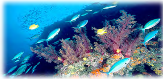
ภาพวันทะเลโลก สืบค้น 10 พฤษภาคม 2561 https://scoop.mthai.com/specialdays/6504.html

รวบรวมเรียบเรียงโดย นางชวนพิชญ์ รัตนาไพบูลย์ บรรณารักษ์ชำนาญการพิเศษ