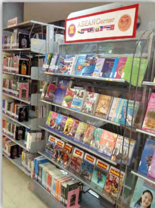
มุมอาเซียน (ASEAN Corner) ในห้องสมุดรัฐสภา

สิ่งที่ทราบกันดีอยู่แล้วว่าในปี พ.ศ. 2558 ประเทศไทยและประเทศสมาชิกอาเซียนจะรวมตัวกันเป็นประชาคมอาเซียนอย่างเต็มรูปแบบ ซึ่งจะก่อให้เกิดการเปลี่ยนแปลงอย่างมากแต่ละประเทศสมาชิกจำเป็นต้องปรับตัวเตรียมพร้อมในหลาย ๆ ด้าน โดยเฉพาะเรื่องคุณภาพคน นับว่ามีความสำคัญที่สุดต่อการรับมือกับความเปลี่ยนแปลงดังกล่าว เพราะเป็นที่ประจักษ์ชัดว่าแม้แต่ประเทศที่ไม่มีทรัพยากรธรรมชาติแต่หากมีคนที่มีความรู้แล้ว ประเทศนั้นย่อมสามารถสร้างความมั่งคั่งและพัฒนาสังคมให้เกิดความผาสุกได้