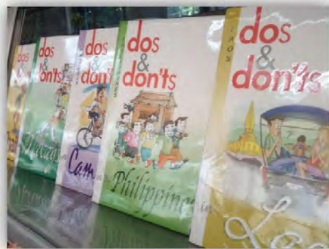
หนังสือเกี่ยวกับประเทศสมาชิกอาเซียนภาษาไทย และภาษาต่างประเทศ