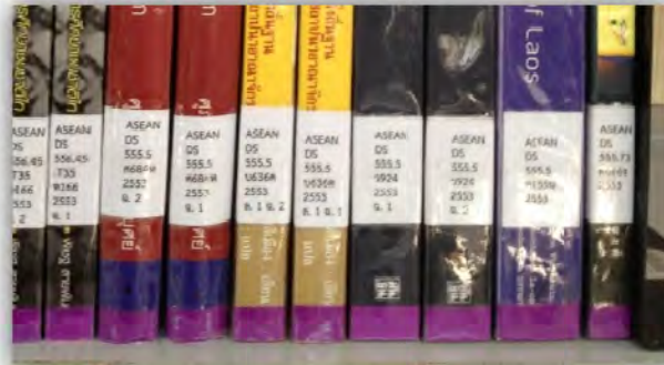
สัญลักษณ์ของหนังสือมมาอาเซียน