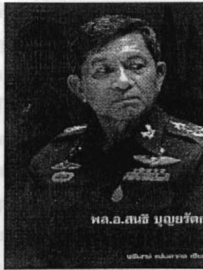
พล.อ.สนธิ บุญยรัตก

เรื่องย่อโดย นางสาวอัญญา ทิมแกตุ บรรณาภิรมย์ ๔